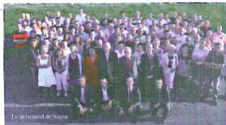
Le personnel de Sagra